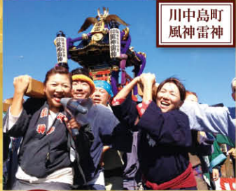
川中島町 風神雷神